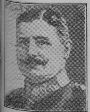
El nuevo Ministro de la Guerra alemán general Groener.

En el óvalo se ve a Su Majestad el Rey conversando con Su Alteza la Infanta doña Luisa.