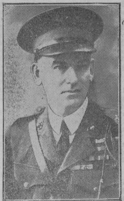
El general norteamericano Logan Feland que manda las fuerzas que operan en Nicaragua contra el general Sandino.

crito de la defensa de Luis XVI, al lado de unas estampas que representan la huida a Verennes. Luego, la carta trágica del rey, pidiendo un plazo de tres días para prepararse para la muerte, y la respuesta: «La Convención lo pasa al Orden del día».