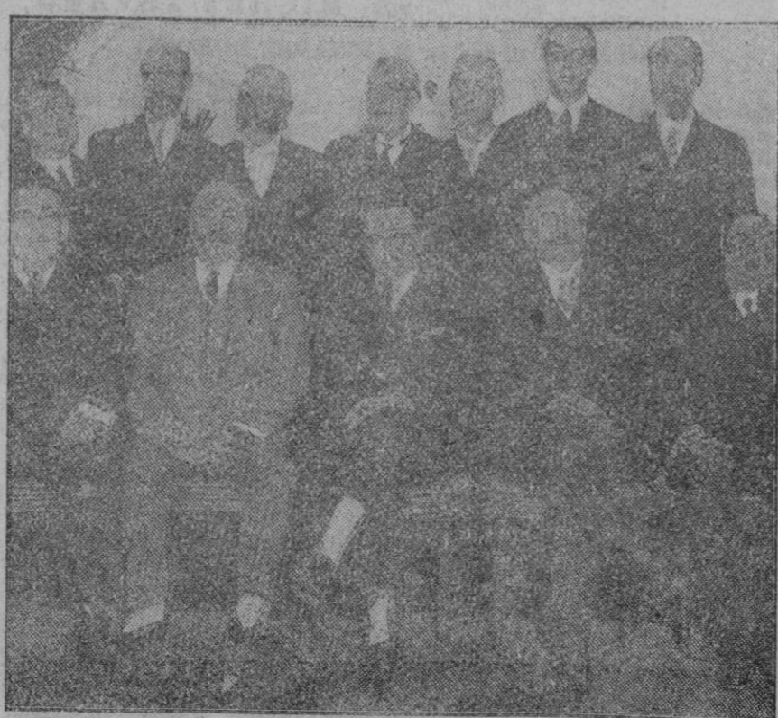
MADRID.—Los Comités de Madrid y Barcelona de la Exposición de Industrias Eléctricas, han celebrado un banquete en el Hotel Ritz, presidido por el Duque de Hornachuelos y el Marqués de Foronda.

mente con una piedra. Mientras se sumergía, el mecanismo de clausura de los ventiladores funcionaba defectivamente. A bordo se encontraban 63 hombres, los tripulantes y algunos obreros de la casa constructora. Los 31 hombres que se hallaban en los compartimentos de popa perecieron inmediatamente, porque no hubo manera de evitar que penetrara el agua. Los 42 que se hallaban en proa fueron salvados porque el agua no pudo penetrar en el compartimiento de aquella parte de la nave. Pero a qué precio y después de qué titánicos esfuerzos y de qué horas angustiosas! Los buzos habían logrado ponerse en comunicación con los tripulantes del sumergido. Veinticuatro horas después del hundimiento, el jefe de la