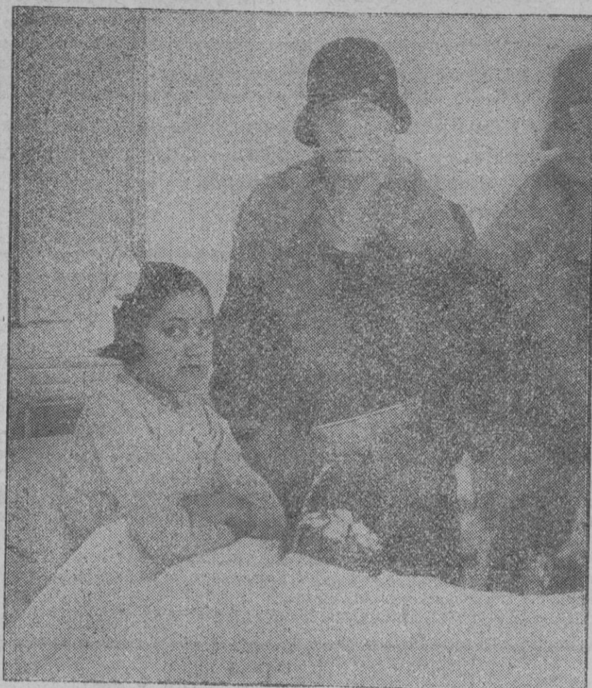
MADRID.—Su Alteza Real la Infanta doña Cristina, repartiendo juguetes entre los niños pobres del Hospital del Niño Jesús.

El sumergible fué puesto en sentido perpendicular, de modo que la proa sobresalía a la superficie; entonces con una potente llama oxihídrica, se abrió en el casco un agujero, y por él salieron los supervivientes.