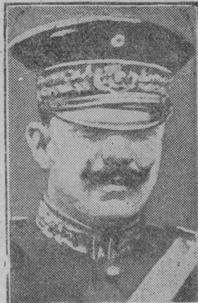
El general Gómez, uno de los jefes del movimiento mejicano, que acaba de ser fusilado por las tropas gubernamentales.

Un automóvil del servicio militar en los alrededores de Méjico para vigilar la entrada de personas, previa identificación, en la capital.