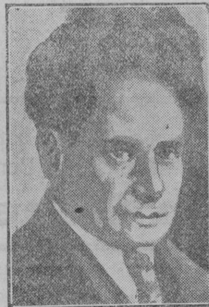
El periodista de fama universal, Maximiliano Harden, que ha fallecido recientemente.