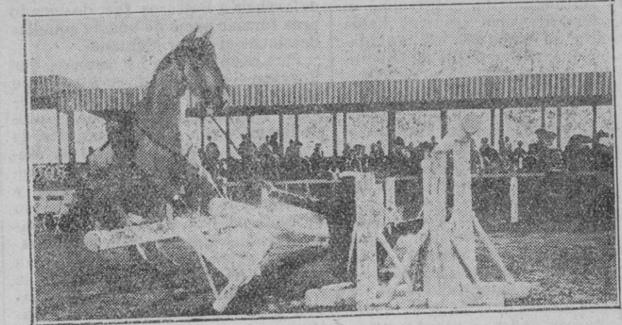
MELILLA.—Una caída peligrosa de un jinete, durante el Concurso Hípico celebrado en dicha ciudad recientemente.

Y gracia del partido de la máxima emoción, Español-Barcelona, amaneció lluvioso y continuó con este cariz durante toda la mañana y el transcurso de la lucha.