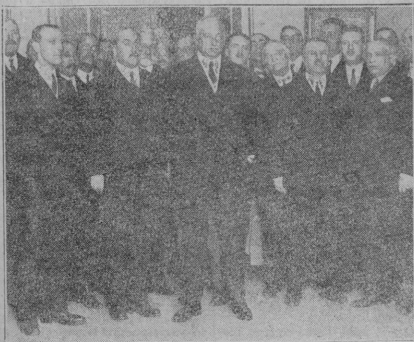
MADRID.—En el salón grande de «Unión Patriótica» se celebró la conferencia del Ministro de Fomento Marqués de Guadalupe sobre los planes de Obras Públicas, revelándose como un notable orador, porque como técnico en la materia es uno de los más versados en nuestra nación. Asistió el Presidente del Consejo que pronunció también un breve discurso, elogiando al Ministro de Fomento. Asistieron muchas personalidades y un enorme gentío que se repartió por todas las dependencias de la casa, quedándose muchos sin oír la disertación.