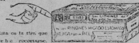
Esta es la tira que debe recortarse.

Representantes generales para España: Establecimientos Dalmáu Oliveres, Sociedad Anónima. P.º Industria, 14. Barcelona.