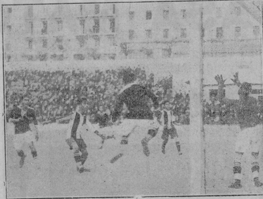
Un momento de peligro en el partido Athletic-Madrid, venciendo por 3 a 2.—Campo de Chamartín.

Barcelona 14 (9 m.) Ayer, gran día deportivo por obra