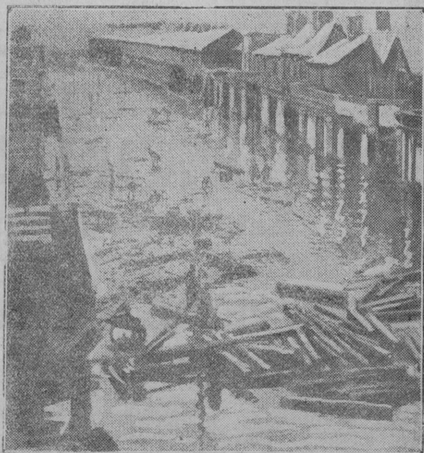
Aspecto de una calle de Fleetwood cubierta por las aguas del mar que superó en siete metros el nivel ordinario a causa del temporal y que ocasionó más de cien muertos.