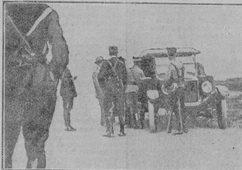
LOS SUCESOS DE MÉJICO

Un automóvil del servicio militar en los alrededores de Méjico para vigilar la entrada de personas, previa identificación, en la capital.