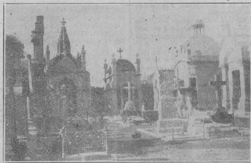
Ensanche del Cementerio: Grupo de capillas de una de las principales vías.

Poco después un proveedor estuvo llamando inútilmente en el piso de