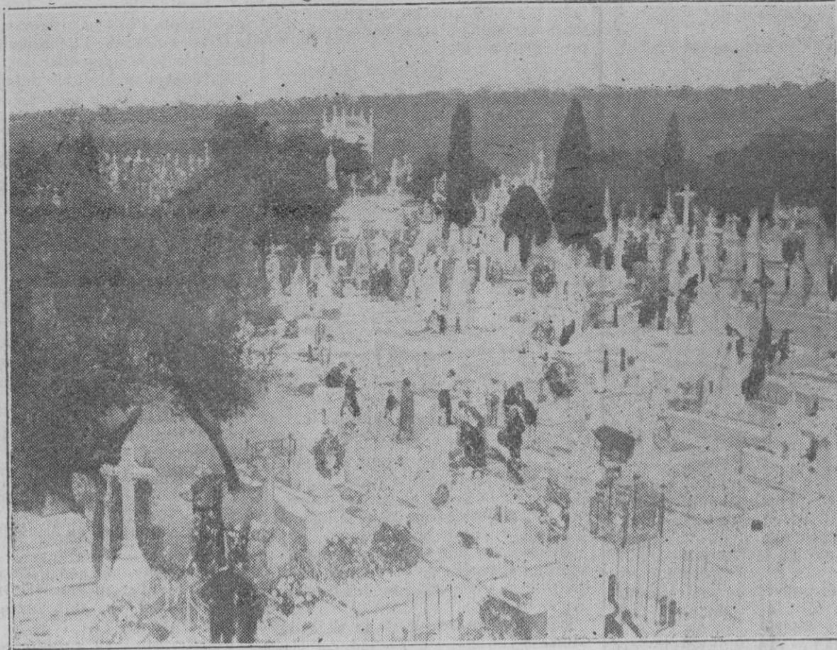
Una sección del Ensanche de Cementerio - Arreglando tumbas y panteones para la festividad del día.

Inmediatamente se dieron órdenes para la busca y captura del capitán ruso; pero éste había desaparecido de Niza, y todos los trabajos hechos para encontrarle han resultado hasta ahora infructuosos.