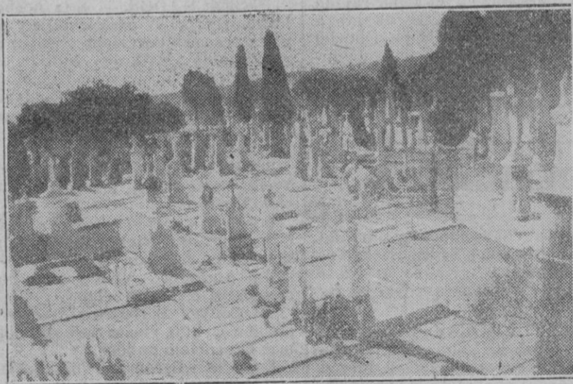
Vista general de la sección de jardines del Ensanche de nuestra magnífica Neópolis.