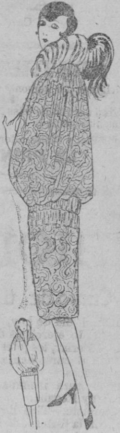
CAPA.—Bonita capa de tejido bordado en verde y plata. Franca en cuello y manga. Cuello médis en cibelina.

bellos cortos crezcan algunos centímetros, la cabeza quedará pequeña, pero conservará el carácter eminentemente práctico de la coiffure corta.