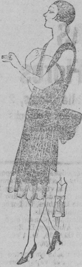
VESTIDO DE DANZING Y DE TE. Gracioso vestido de te en crespon saten negro con ancho cinturón abrochado por detrás. Pechera y bajos en tejido de plata.