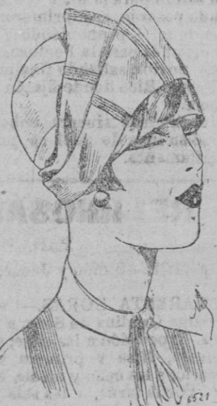
SOMBRERO.—Toca de terciopelo verde Trianon guarnecido de fruncidos y de «minches», de «tracilles» tono sobre tono.

Las mangas son muy curiosas. Anchas o estrechas tienen mucho carácter. Ensanchadas, se vuelven en un amplia revés que se abotona sobre el antebrazo. Estrechadas se parecen a mitones y van trabajadas a la altura del codo con incrustaciones de un tinte opuesto. Los vestidos del tiempo gustan todavía a la mayoría de las coquetas, y ponen muy hábilmente en valor el encanto propio que hace todo su éxito. El tul compone con mucho acierto alguna de ellas. Por su lige-