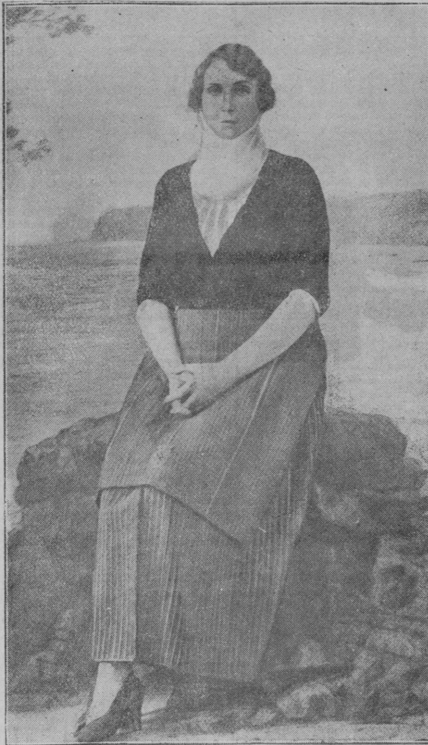
Retrato de la Reina con el traje de payesa que le regalaban los vecinos de La Puebla.

En los ventisqueros se han encontrado muchas cosas perfectamente conservadas por el hielo durante muchos años: un rebaño de ovejas, un enjambre de langostas, cuerpos humanos, aves de muchas especies y hasta un mamut perfectamente conservado en un río de hielo de Siberia.