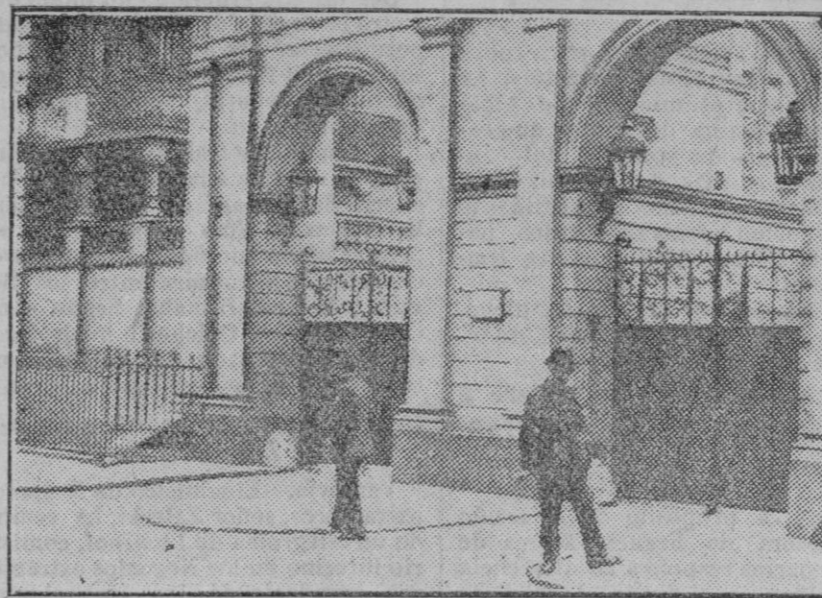
EL CONFLICTO ANGLO-RUSO.

Edificio de la Embajada Rusa en Londres vigilado por la policía inglesa.