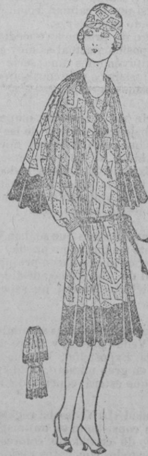
TRAJE.—Traje de velo estampado fondo blanco estampado azul, adorno y bieles de China azul.