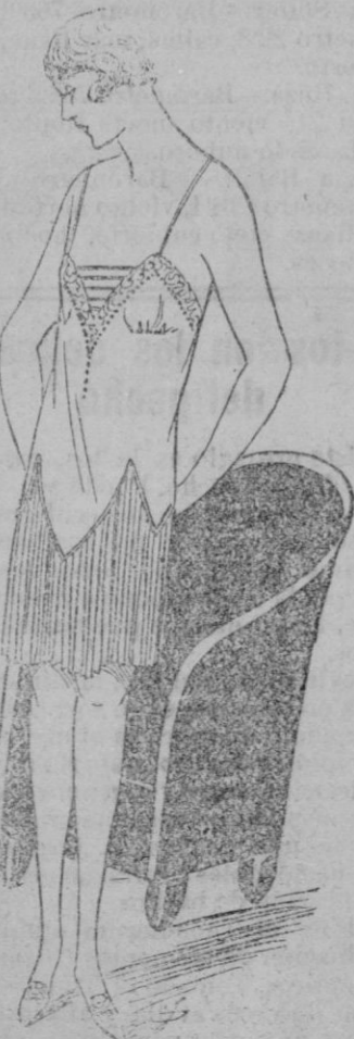
CUBRE-CORSE-REFAJO.—Este encantador modelo será si se quiere en velo triple pensamiento, la falda será enteramente plisada, y el corsélete recortándose entre dientes puntiagudos será adornado con Valenciennes, mientras que el delantero será unido por delicadas pequeñas cintas del mismo tono.

—El traje de mis niños, nos decía últimamente una mamá elegante, constituye para mí una gran preocupación. Efectivamente, así es en la generalidad de los casos y esto se explica no sólo por el hecho de que por ley natural a los padres corresponde la misión de vigilar por el bienestar y buena apariencia de sus retoños, sino porque la elección del traje infantil en cierto modo equivale a la de