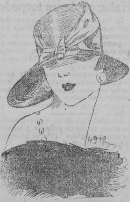
SOMBREIRO.—Un poco irregulares las formas de Susy, de crin, se acorbatan con bieles de terciopelo. De una sencillez encantadora, terminan la gracia de los trajes transparentes y pueden acompañar al tailleur sobrio.