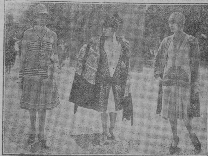
Ultimas creaciones aparecidas en Longchamp.

Es difícil determinar cual es la piedra preciosa más estimada. En esto como en todas las cosas interviene el gusto personal y lo que para ciertas personas presenta un valor considerable para otras reviste un interés bastante menor. No obstante