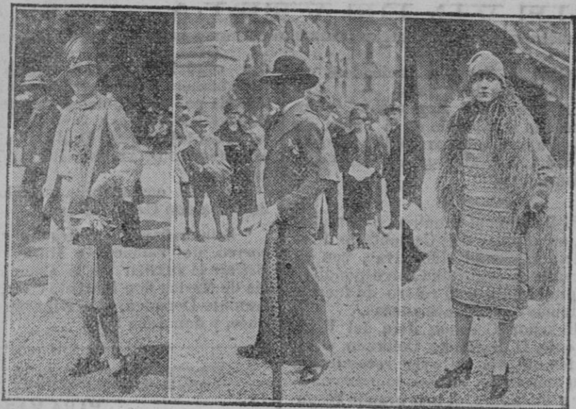
Ultimos modelos de las modas femeninas y masculina.