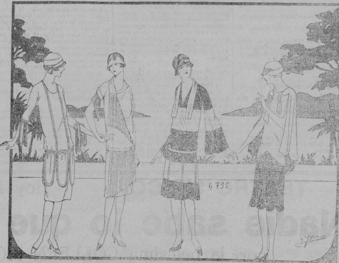
PANORAMA TOALETAS.—En este panorama, figura 1, el traje georgette malva tiene una tónica recortada en anchos dientes horlados con tres gansas. Las mismas gansas suben por el cuerpo y siguen el escote hasta la espalda. Pequeño cierre de joyería.—2 Crepé de china azul lavanda plisado abotonado por un grueso botón de nácar. La pechera es retenida por un pequeño cuello de organdi blanco. Reversos de organdi en las mangas. 3 Crepé georgette marina y crepé blanco, falda de gruesos pliegues vacíos, écharpe blanca.—4 Satén marfil y satén negro forman el conjunto completado por una pequeña capa de satén blanco forrada de negro.

A Magazine of fine and applique art. Revista de arte, meses de Abril y Mayo. 4 pesetas ejemplar. De venta en la Librería Tous.