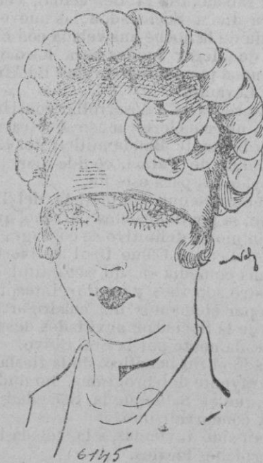
SOMBRERO.—Forma de picot maderera de rosa adornado con pétalos.

La mujer más rica del mundo es de origen muy humilde y hasta 1905 no ostentó más que la categoría de esposa sumisa de un pequeño fabricante de azúcar que nadie conocía en el mundo de los grandes negocios. En Octubre de 1905 el fabricante de azúcar murió después de rápida enfer-