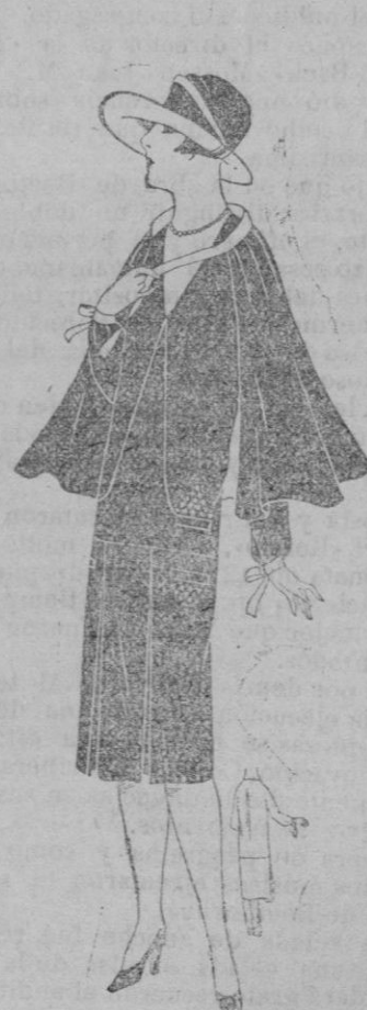
TRAJE.—Traje y capa de alpaca verde musgo. Pequeños bolsillos y motivos de botones morados dispuestos en triángulos. Cinta verde clara en el cuello y en los puños.

Recibidas las Novedades de Primavera y Verano.