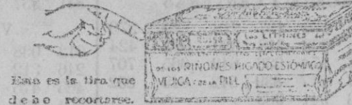
Esas es la tira que debe recortarse.

Representantes generales para España: Establecimientos Dalmau Oliveres, Sociedad Anónima. P.º Industria, 11. Barcelona.