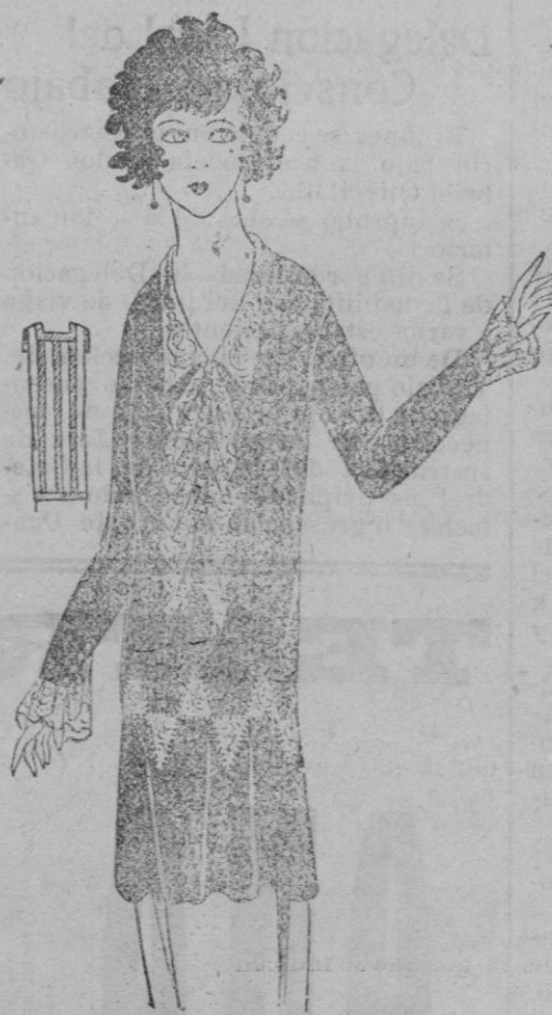
CASACA.—He aquí una casaca de crepé de china avellana, incrustada de encaje avellana, rebordada ligeramente con oro.