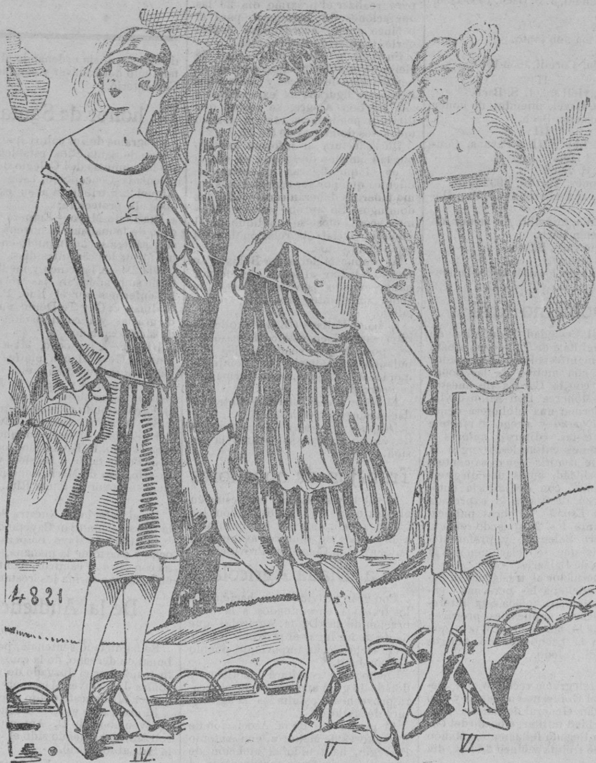
PANORAMA TOALETAS.—Una nueva concepción de la en forma con los volantes unidos formando puntos sobre el forro unido.—La muselina de seda azul pastel forma una falda y un delicioso adorno, en este traje de terciopelo azul rey.—De alpaca ciclaman, sobre un chaleco verde, esta sencilla toaleta es, gracias a su corte, de cierto chic.