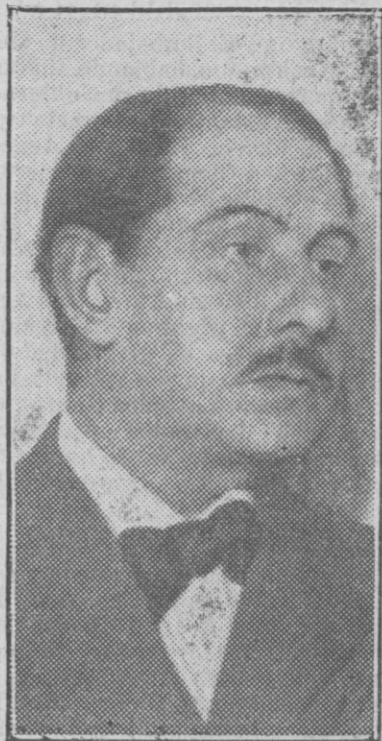
El insigne poeta Eduardo Marquina autor de la celebradísima comedia dramática Fuuto Bendito .

Lo cual demuestra que, en la mujer, la habilidad de observar, de una sola ojeada, la indumentaria de otra mu-