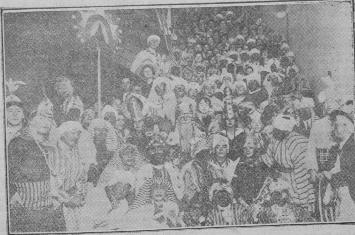
GRANADA—LA FIESTA DE LOS REYES MAGOS

Y, en los pueblos de casi todas estas provincias donde la continuada lluvia amenazaba la pérdida de la