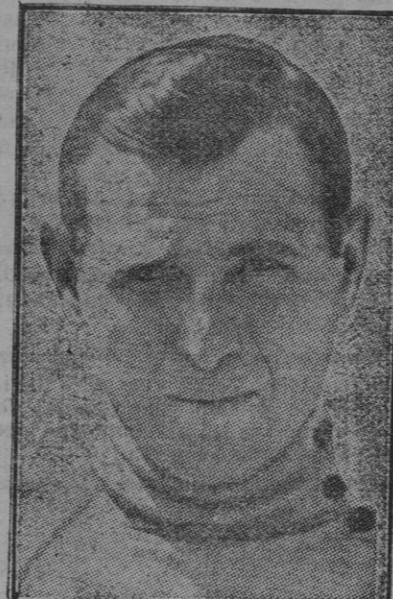
PARIS.—Lucien Buysse, el corredor ciclista vencedor absoluto de la vuelta a Francia en bicicleta.

De ocurrir esto, la política interior de Inglaterra sufrirá una profunda modificación y se inspirará exclusivamente en los principios socialistas. Y acaso por esta parte sea Inglaterra el solo país en que pueda asistirse a una revolución socialista realizada parlamentariamente...— Consortium , Julio de 1926.