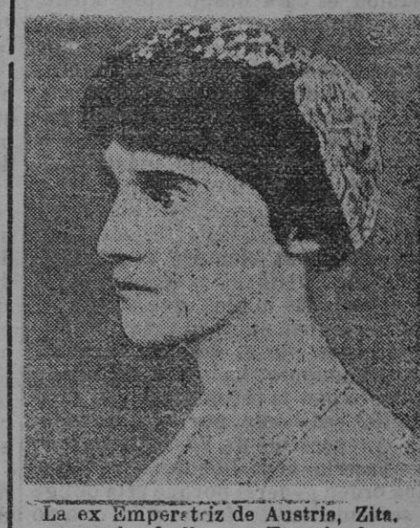
La ex Emperatriz de Austria, Zita, que acaba de llegar a Francia, donde permanecerá un tiempo en compañía de sus hijos.