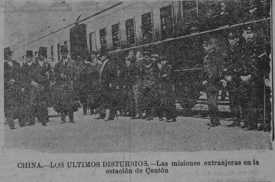
CHINA.—LOS ÚLTIMOS DISTURBIOS.—Las misiones extranjeras en la estación de Qantón.

¿Cuáles serán exactamente las formas y los colores que dominarán la próxima estación? Pero poco importa; el parisiense posee el arte sutil de adaptar su silueta a la moda, que acaba siempre por tener razón.