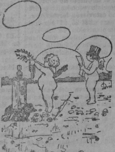
¡Oh, PECA CURA! Yo te saludo. Honorado a España te coronamos; pues lo castizo de la española lograron solo, Cortés hermanos.

En punto céntrico de San Bartolomé, espacioso piso con baño y jardín, agua abundante y canalizada al piso Precio módico. Informes: Jaime II, 37--Palma.