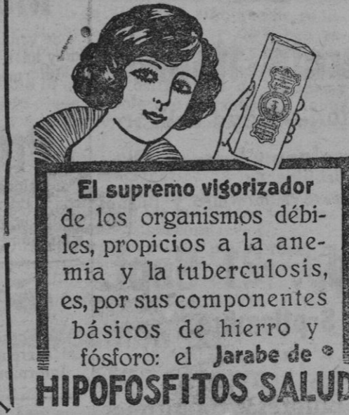
El supremo vigorizador de los organismos débiles, propicio a la anemia y la tuberculosis, es, por sus componentes básicos de hierro y fósforo: el Jarabe de HIPOFOSFITOS SALUD

habían oído hablar a su amo de aquel primo que le venía de Portugal. —Sin embargo —le decía Francisco a su mujer, —he observado, que desde que está aquí el conde de Rogas, nuestro amo se ha hecho más serio y razonable: esto indica, que su primo le ha aconsejado bien, y eso es lo principal. Dios quiera que aun esté a tiempo para evitar su ruina completa.