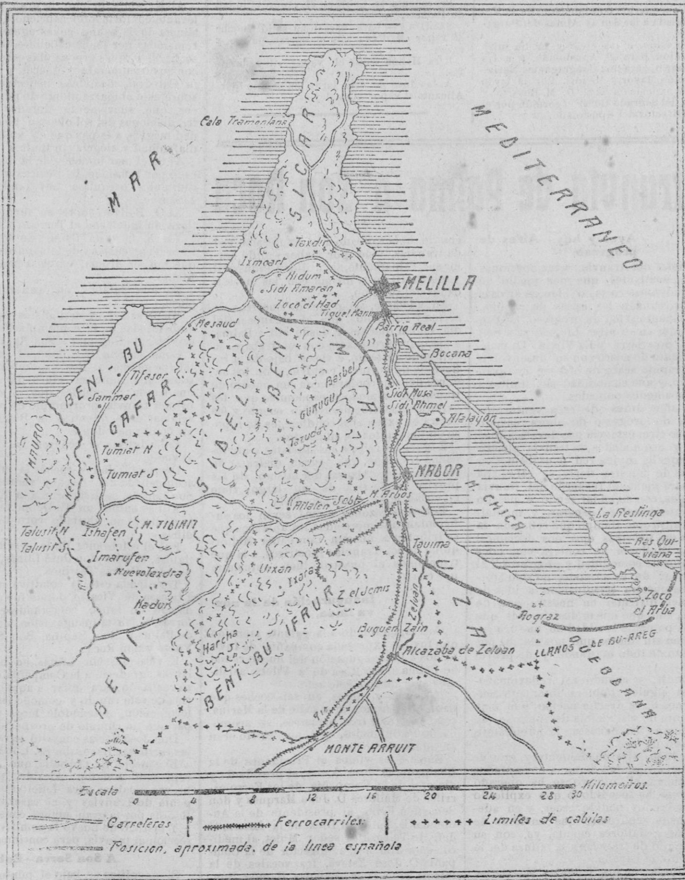
Mapa en el que se detalla el último avance de nuestras tropas en Africa. La línea de trazo grueso indica la actual situación del ejército que con sus últimas operaciones ha establecido el contacto desde Zoco el Arba hasta Ixmoart, pasando por Aograz, Nador y Zoco el Had.