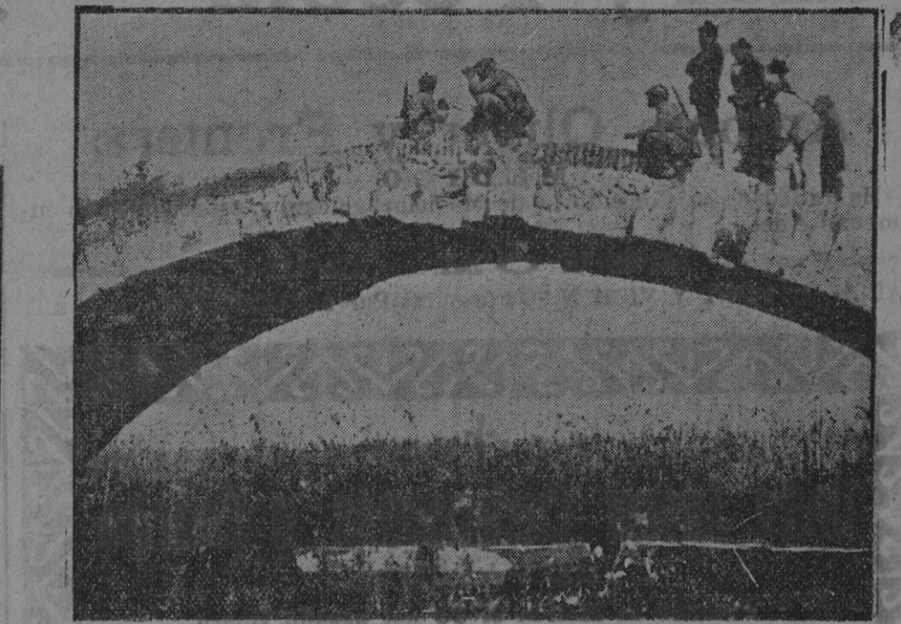
EL CONFLICTO EUROPEO.—Los monumentos romanos sirven a la guerra

He aquí que de repente Alemania y Austria-Hungría extienden la zona de