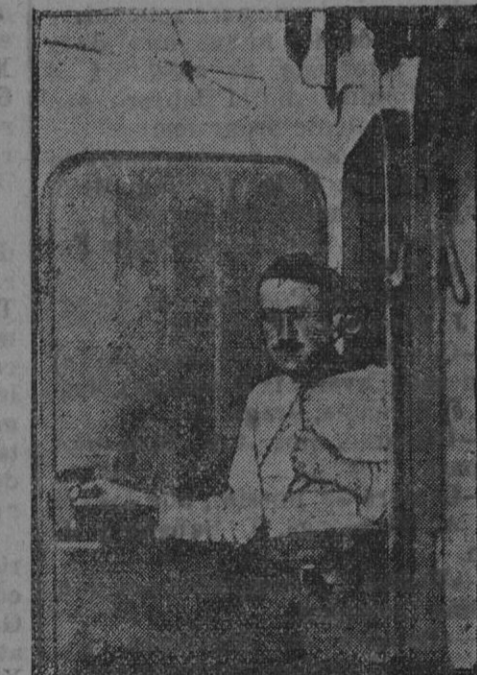
El teléfono a bordo

Su organización Existe un jefe de operaciones navales, nombrado por el Presidente de la República, y está bajo las órdenes del ministro, encargado de las operacio-