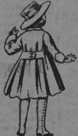
N.º 104.—Abrigos de patén para niñas de 4 a 9 años. De pts. 15 a 17.