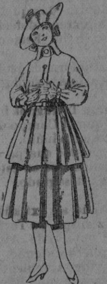
N.º 97.—Trajes de lana, para jovencitas de 12 a 15 años. De pts. 45 a 55.

Precio Fijo. Ventas al contado Pidase el Catálogo general