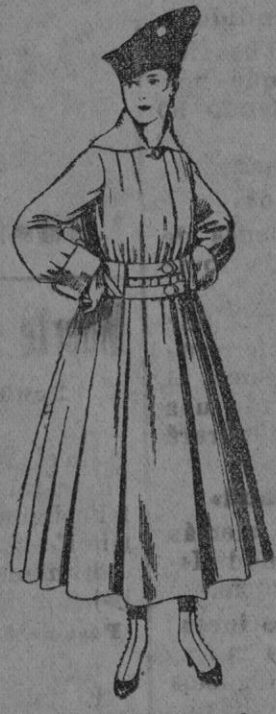
N.º 50.—Abrigos de patén color, para señora. De pts. 50 a 60.