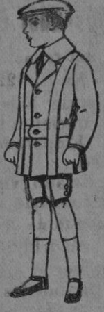
Traje de patén para niños de 4 a 9 años. De pts. 12 a 33.