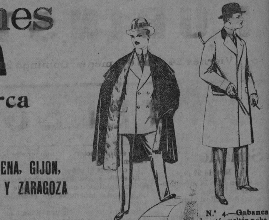
N.º 9.—Capas (enteras) de paños de Béjar y Tarraza, embozos de peluche, terciopelo, astracán o escocés. De pts. 55 a 115.

Gorras, Sombreros, Cinturones, Calcetines, Corbatas, Fajas, Ligas, Tirantes, Leggings, etc.