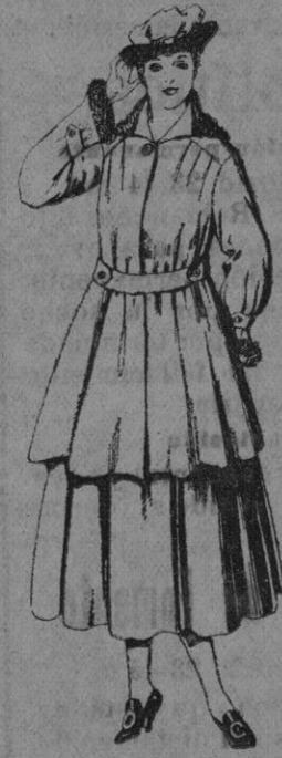
N.º 46.—Traje de punto en color para señora. De pts. 130 a 180.