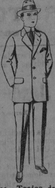
N.º 23.—Trajes de patén, vicuña, o jerga, para niños de 10 a 12 años. De pts. 15 a 50. Los mismos, para jóvenes de 13 a 16 años. De pts. 16 a 53.