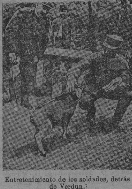
Entretención de los soldados, detrás de Verdun.

Varios de ellos fueron torpedeados a grandes distancias de tierra; algunos a más de cien millas.