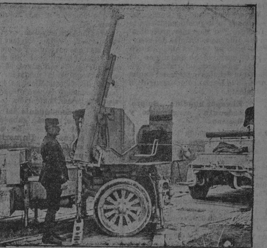
Auto-cañon con el cual se combate a los zeppelins.