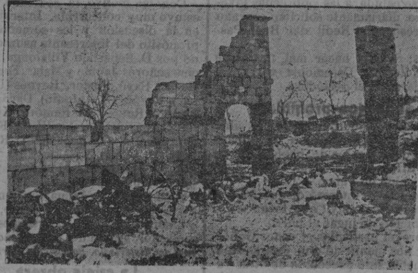
Ruinas de Hennebet al este de Verdun.