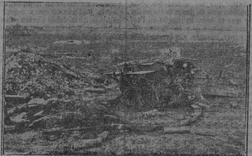
De la batalla de Verdun: restos de una batería.