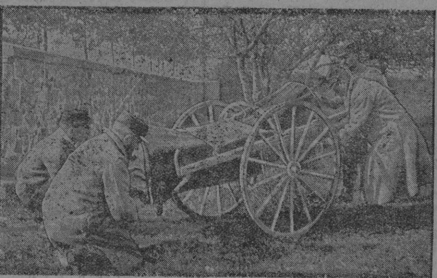
Ultimo modelo de casaca que se usa en el frente de campaña