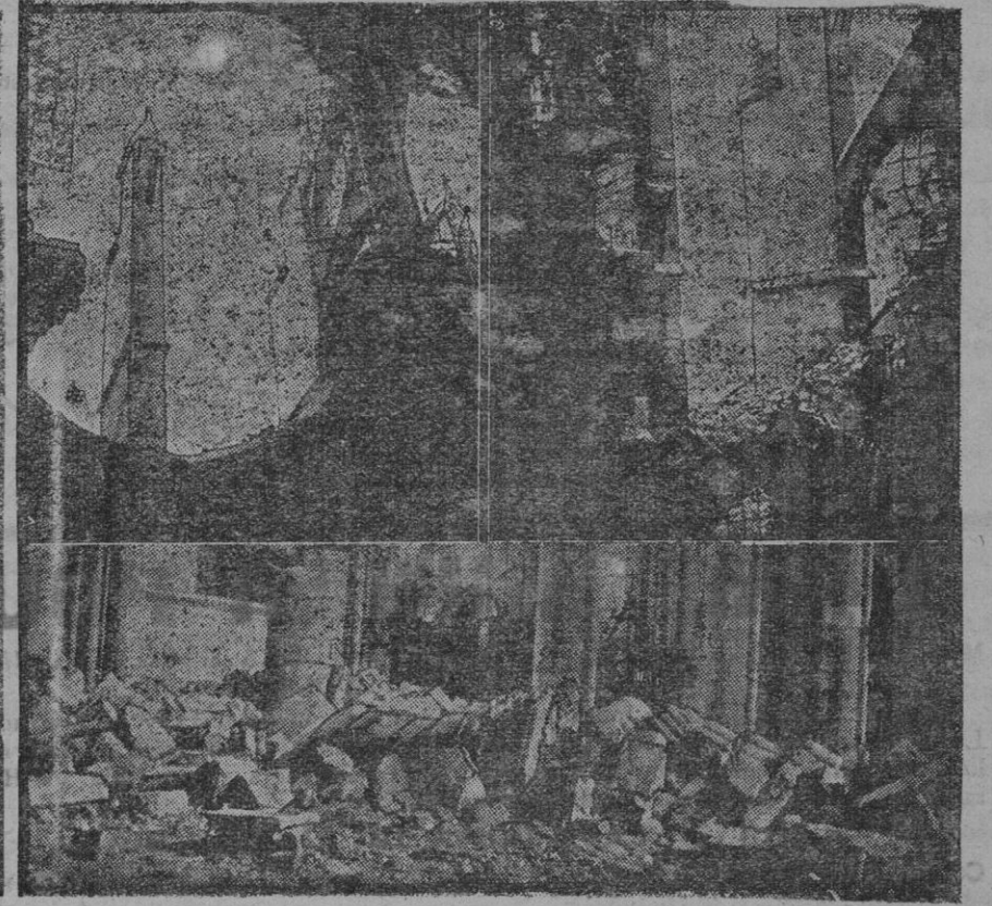
La Catedral de Soissons después del último bombardeo. En la parte alta, las dos vistas son del exterior y en la parte baja, del interior.