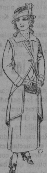
Trajes de lanilla, para jo- vencitas de 13 a 16 años De pts. 40 a 45