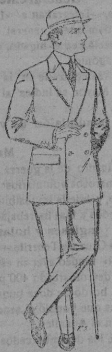
Trajes de cheviot, patén, etc. De pts. 25 a 80

Gorras, Sombreros, Cintu- rones, Calcetines, Cor- batas, Fajas, Ligas, Ti- rantes, etc., etc.