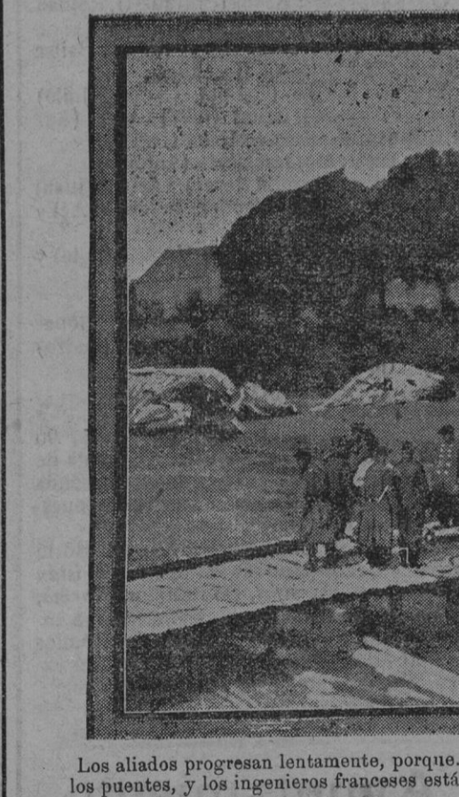
Los aliados progresan lentamente, porque... Detrás de sí los alemanes han hecho saltar los puentes, y los ingenieros franceses están trabajando constantemente para repararlos.