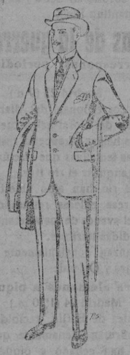
Trajes de patén cheviot, etc. De pts. 17'50 a 70