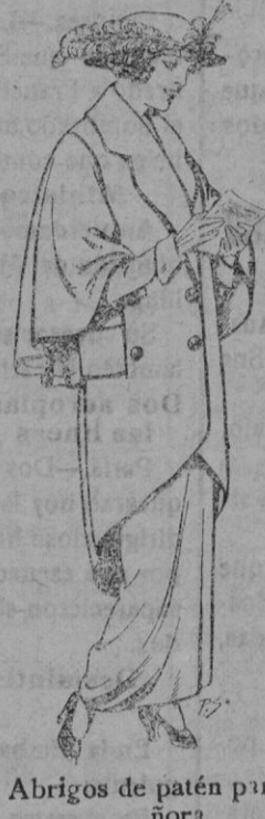
Abrigos de patén para Se- ñora De pesetas 55 a 65