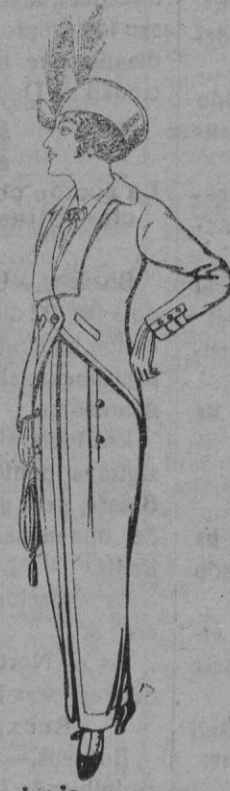
Trajes jersey negra para Señora Pesetas 65