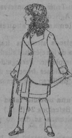
Trajes de lanilla para ni- ñas de 4 a 12 años. De pts. 14 a 22