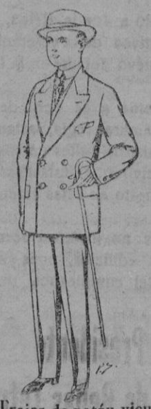
Trajes de patén vicu- ña, etc., para niños de 10 a 16 años. De pesetas 25 a 48