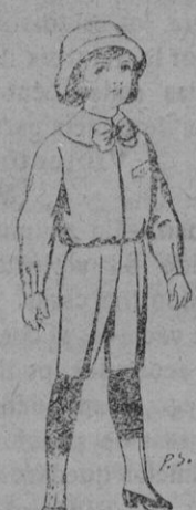
Trajes patén para niños de 4 a 9 años. De pts. 5 a 5'50.