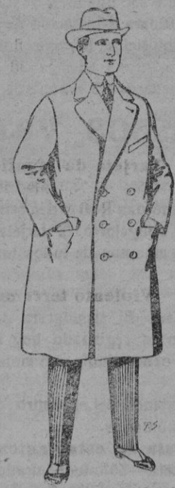
Gabanes de patén y cheviot De pts. 55 a 105