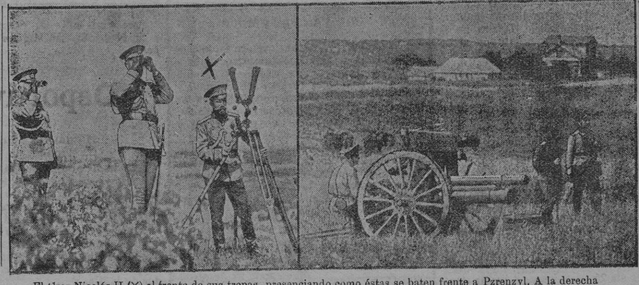
El Czar Nicolás II (X) al frente de sus tropas, presenciando como éstas se baten frente a Pzenzyl. A la derecha piezas de la artillería rusa que han reducido al silencio algunos fuertes de la población.

«La Gaceta Alemana del Norte» dice lo siguiente acerca del Kaiser: «El Kaiser salió de Berlín el 16 de agosto hacia el gran Hauptquartier de Koblenz. Sin notarse las atrevidas medio Imperio. En vano se buscó en el Oeste el tren blanco y azul; entretanto se habían cambiado los colores. Esta precaución ha salvado al tren de las bombas de los franceses. Pero hay otros motivos que obligaron al Monarca a tomar medidas de precaución, que no puede retirarse lejos de los cañones enemigos, como hace el Presidente de la República; el Kaiser quiere siempre estar en contacto con sus tropas. Siempre, hasta ahora, se ha acercado a los combatientes en automóvil, rodeado de ayudantes, guardias de Corps y de agentes de policía secreta, organizados bajo el nombre de Policía secreta de campo, que se ocupa también de la seguridad del ejército contra espionajes y atentados. Es así que el