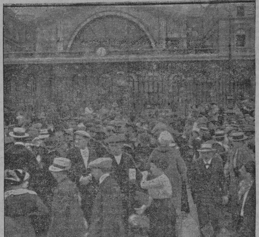
La muchedumbre estacionada frente a la estación del Este, de Francia, durante el embarque de reservistas