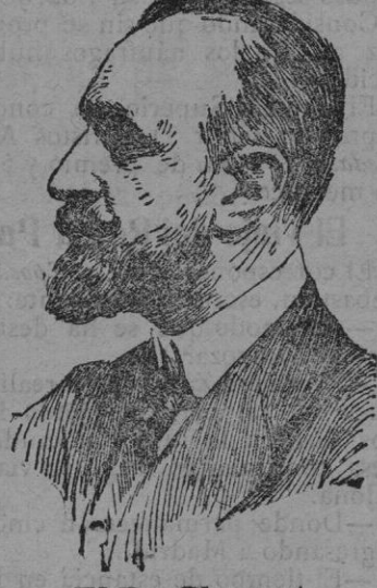
El Dr. Charcot

Para hacer menos duradera las eternas noches de la invernada, esas noches de seis meses, además de una modesta biblioteca recreativa y un gimnasio, el