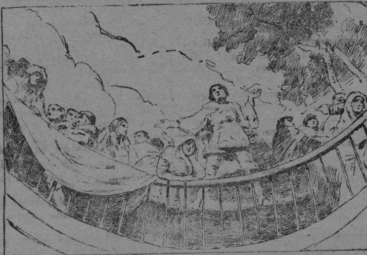
Fragmento de los frescos pintados por Goya en la cúpula de San Antonio de la Florida

Próxima á la montaña del Príncipe Pio, inmediata á las primeras alamedas de la Moncloa y dando su frente al Manzanares, álzase en uno de los sitios más salubres y pintorescos de Madrid una construcción más bien reducida que extensa y de apariencia de templo, que sin llegar á gran iglesia es más que ermita.