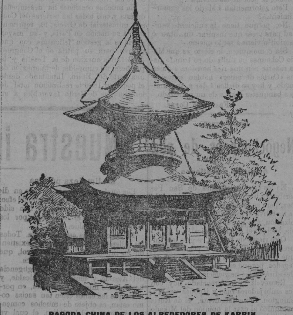
PAGODA CHINA DE LOS ALREDEDORES DE KARBIN

tenido y formar el concepto y aprecio que dispensará a ese género de música religiosa, nuestro espiritual pueblo.