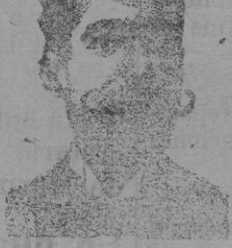
Inventor de los renombrados medicamentos COSTANZI

ROOB ANTISIFILITICO INYECCION VEJETAL Costanzi