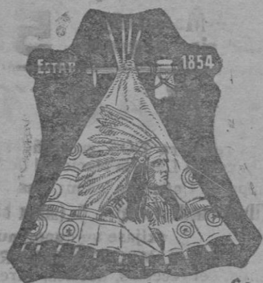
FRED RUEPING LEATHER CO. FOND DU LAC, WIS., U.S.A.

Un símbolo de CALIDAD que se hace posible solamente con la práctica obtenida durante 65 años en la fabricación de cueros para calzado