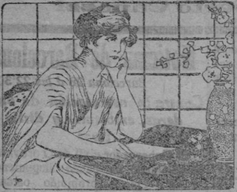
Para escribir correctamente el idioma español es indispensable tener á mano un Diccionario Alemany.

Depurativo, Laxante, Estimulante del apetito y moderador de las secreciones.