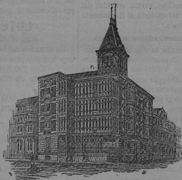
Edificio propio de la Sociedad en Pamplona

N.º 1.—Para que desaparezca el vello N.º 2.—Para que desaparezca el pelo Los prospectos explican el modo fácil de usarlo.—De venta en Palma de Mallorca: Droguería de la Sra. Viuda de José Juan, calle Marina, 20, 22, y 24 y principales droguerías y perfumerías de España y Por tugal.