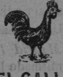
EL GALLO Marca depositada