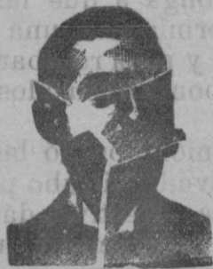
inventor de los medicamentos COSTANZI

Para las Estrecheces Uretrales Uretritis—Prostatitis—Cistitis