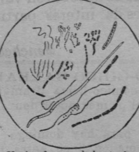
Varias formas de bacterias de la boca