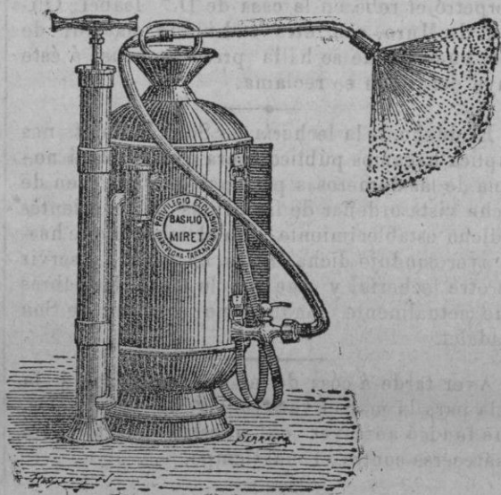
Pulverizador SALABERT (De cobre y latón) Precio: 50 pesetas.

El tan renombrado pulverizador SALABERT, de aire comprimido, honrado con medalla de oro en la Exposición Universal de Barcelona y con otros premios en cuantos concursos ha tomado parte, es ya muy conocido en estas Islas y por lo tanto excusamos hablar de él, pues nuestros paisanos saben á qué atenerse respecto á su bondad. De EL RAYO, aparato nuevo, de palanca, que tenemos el gusto de presentar al público, no titubamos en afirmar que es el más sólido, ligero, práctico y barato de cuantos en su clase hasta el día se han presentado á la venta en España; por haberlos estudiado todos el inventor de EL RAYO á fin de conseguir la mayor perfección posible. Confiamos que el tiempo ha de sancionar nuestro aserto. Ambos aparatos los construye la casa SALABERT Y COMPAÑIA de Barcelona, concesionaria de las patentes españolas, francesas, etc.