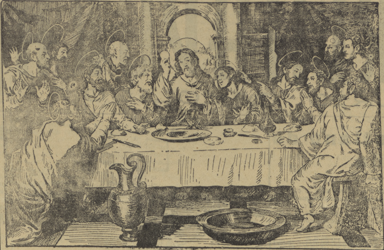
(Juan de Juanes)