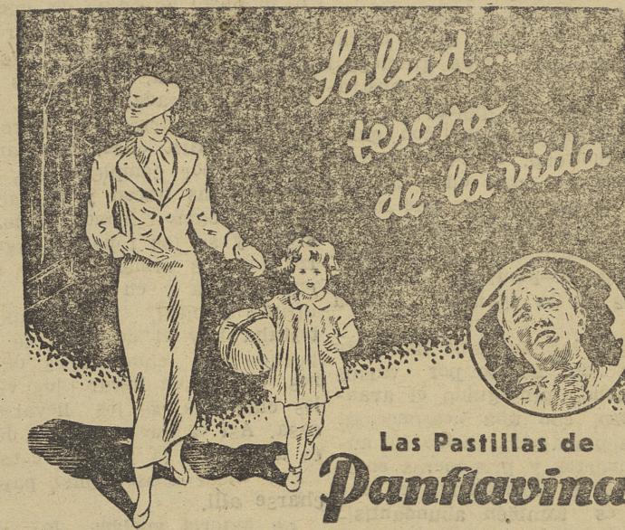
Las Pastillas de Panflavina evitan y curan las anginas y son, además, un poderoso desinfectante de la boca y faringe.

Los que disfrutan de una situación tranquila y libre de riesgos, piensen constantemente que su tranquilidad está comprada, con la sangre de nuestros mejores, en los campos de batalla. A su sacrificio sólo podremos corresponder con el nuestro, generoso y disciplinado, en la retaguardia, al servicio de la Patria.