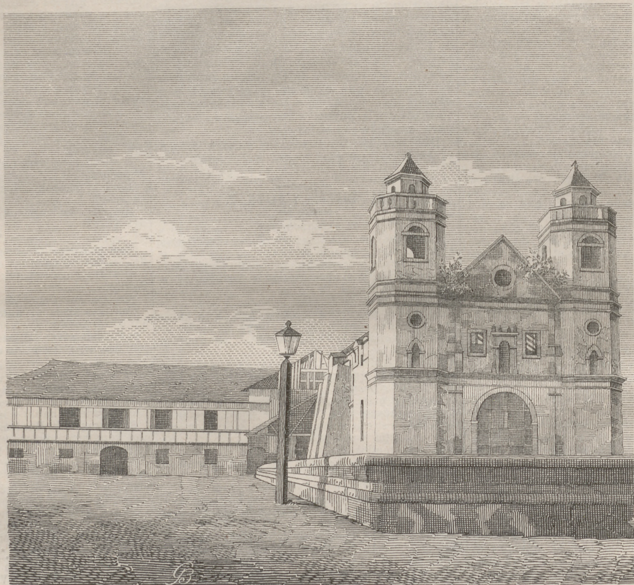
Iglesia del Parian.

y que entran en combinación del mismo modo, y es natural creer que vibren también de igual manera, y en verdad que el olor de uno recuerda el del otro, dependiendo tal vez las diferencias, de la cantidad de materia que vibra, ya que los pesos atómicos son diferentes.