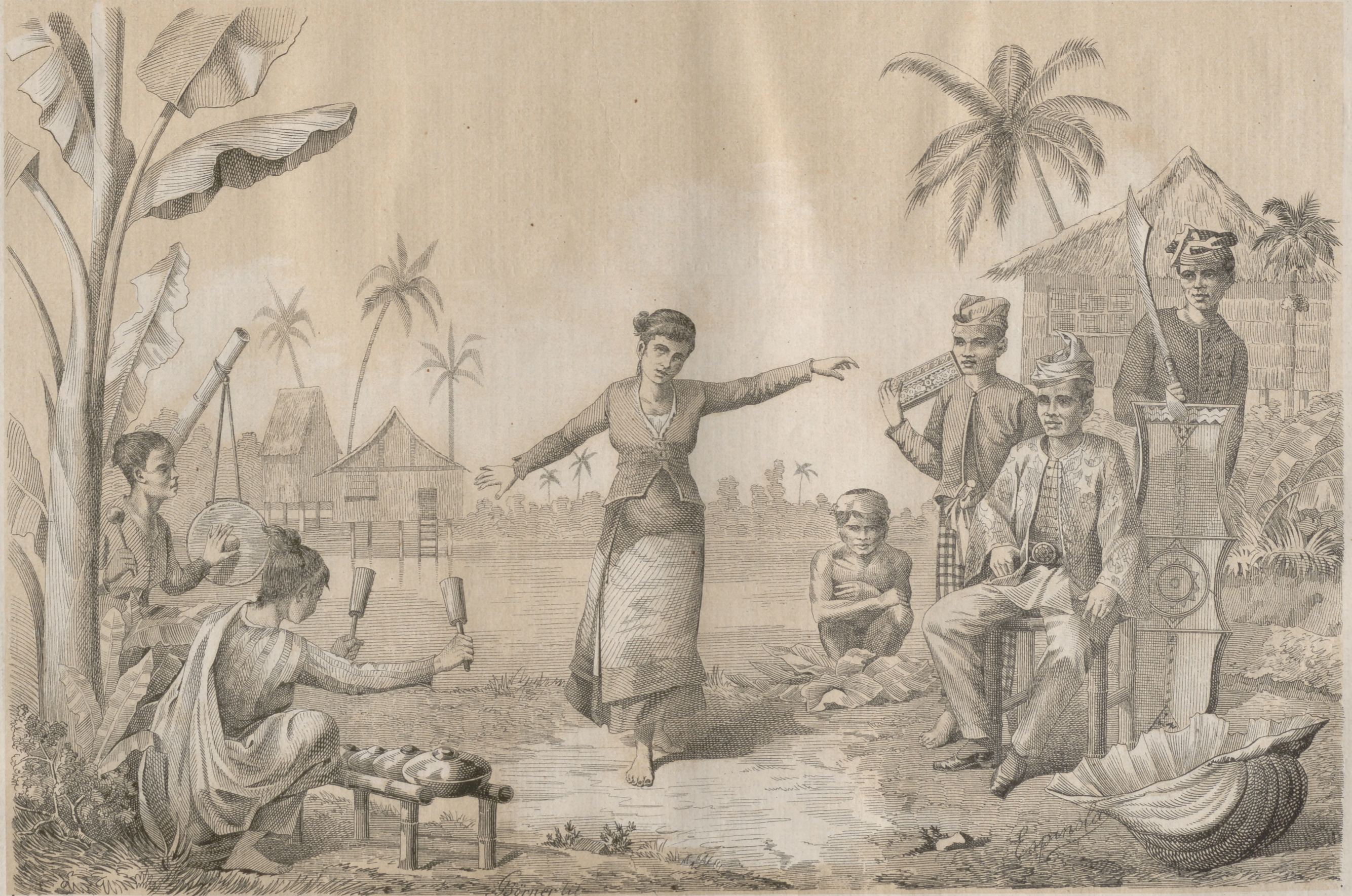
Tipos de Mindanao.