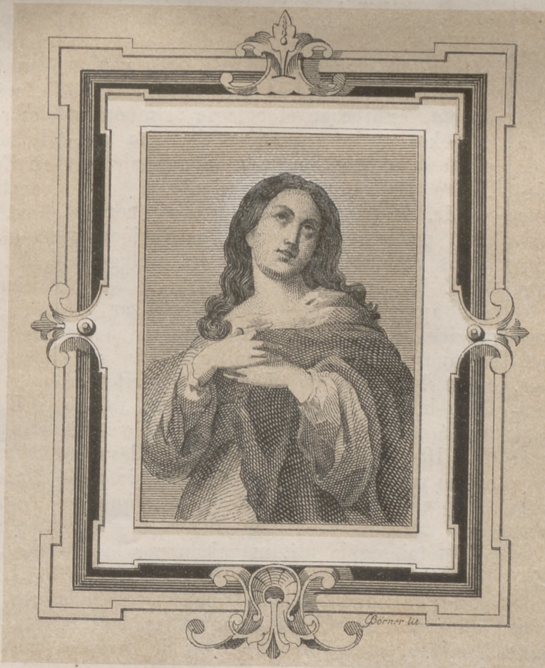
LA PURÍSIMA CONCEPCION.

gira en medio la turbia tempestad en « kirá en medio de la turbia tempestad» capaz de volverle á hundir en su tumba, si de ella hubiera podido levantarse y leerlo, con otras menudencias de las cuales habrá hecho su plato favorito nuestro compañero omega .