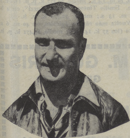
Alejandro Black, campeón motociclista de Portugal, admirable vencedor en la prueba del domingo pasado