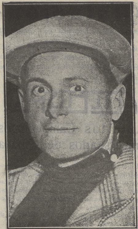
Alfredo Binda, el famoso corredor ciclista italiano gariador, con Di-Pacco, de una prueba de 100 kms., contra reloj, a más de 40 de promedio.

Nicoau, vencedor de esta prueba, llegó a la