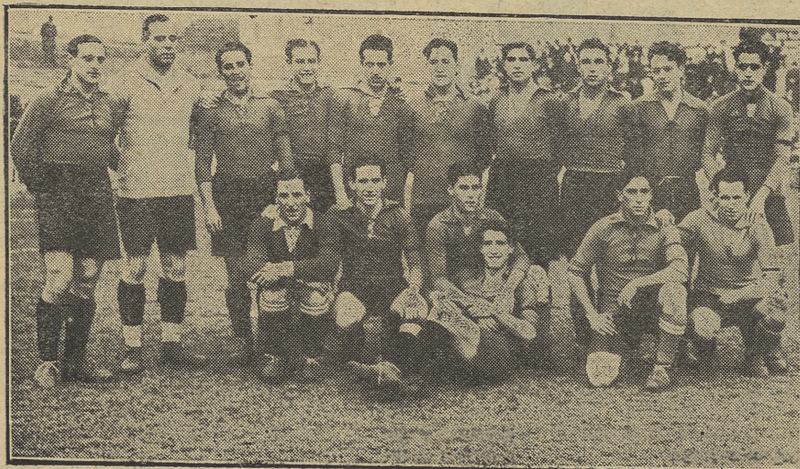
La selección de centro, titulares y suplentes se opuso a la de Cataluña en el encuentro a beneficio del naciente Montepío de jugadores, jugado con expectación el martes último

El Español, ayer, si el campo se hubiese encontrado en mejores condiciones, no hubiese obtenido ese resultado, y si hubiese practicado—como anteriormente digo—el juego abierto.