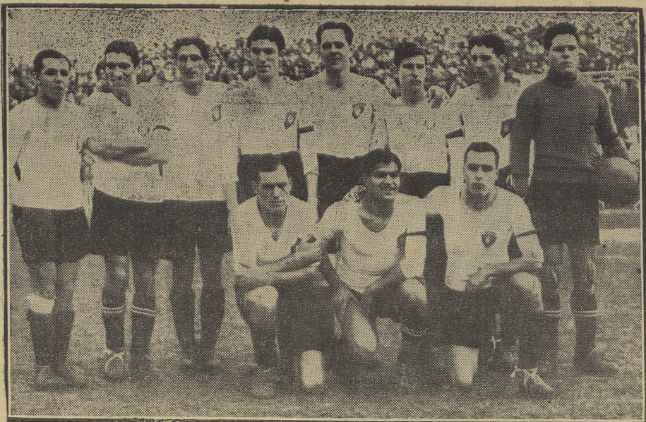
La selección catalana que frente a la del Centro logró el día de Reyes un honroso empate en el campo de Chamartín