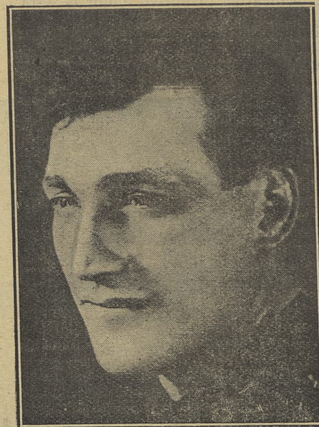
Andrés Leducq, vencedor de la Vuelta a Francia de 1930, que ha sido designado capitán del equipo francés que tomará parte en 1931

Y para que la Sociedad tome las oportunas medidas, tenemos el honor de dirigirnos a usted, como presidente de la misma, para su conocimiento y demás efectos."