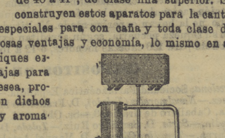
Aparato de rectificación.

Construcción de aparatos de destilación continua para grandes y pequeñas destilaciones de vinos, granos, melazas y otros jugos fermentados, produciendo alcoholos de 95 á 96 grados con ventaja y economía sobre los demás aparatos similares con relación al costo de los mismos y á la cantidad de su producción.