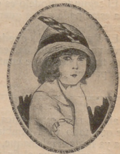
Sombrero de fieltro para niña de tres años, de color rosa, con ala vuelta. Borde de cuero, pluma de cisne.