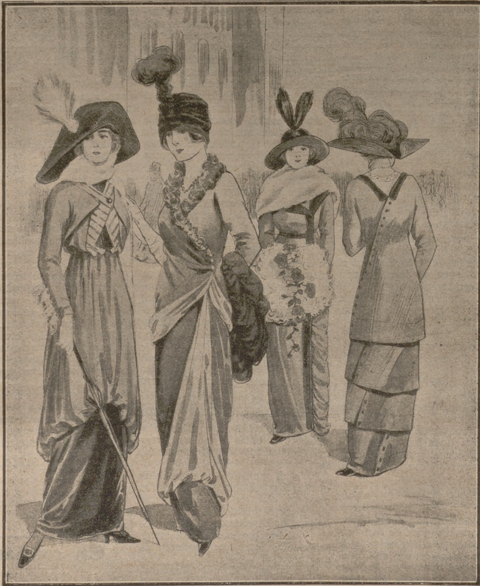
Fig. 1. a Traje de tafetán bronce. Túnica formando "panier,,. Chaleco listado en blanco y verde. Sombrero de paja de Italia bronce con "aigrettes,, blancos.—Fig. 2. a Traje de "charmeuse,, dorada. Chaqueta y túnica drapeadas. Escote de plumas de avestruz rizadas. Turbante de crin negro con pluma dorada.—Fig. 3. a Traje de serga color arena. Un lado de la falda va drapeado. El otro, no. Fig. 4. a Traje sastre de paño verde billar. La falda tiene tres volantes superpuestos. Los botones van puestos en bias. Cuello de terciopelo del mismo color.

mismo estilo, con lo que se adorna el corpiño.