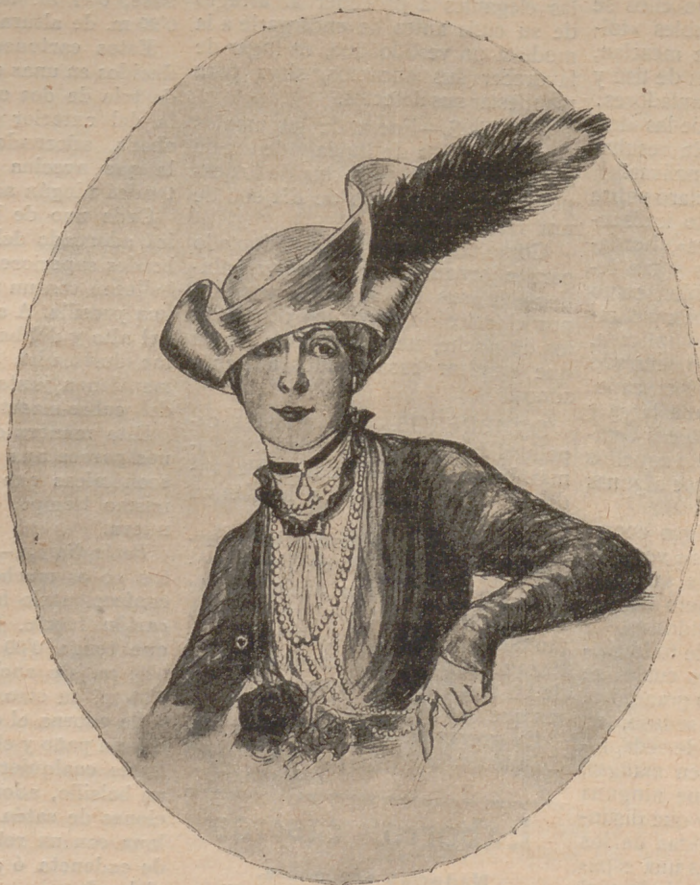
Tricornio de crin color marfit con «jarretiére» de tul. Cola de zibelina en el costado.

Este número contiene dos Suplementos regalos: uno de patrón de cuerpo elegante y otro de labores cuerpo bordado