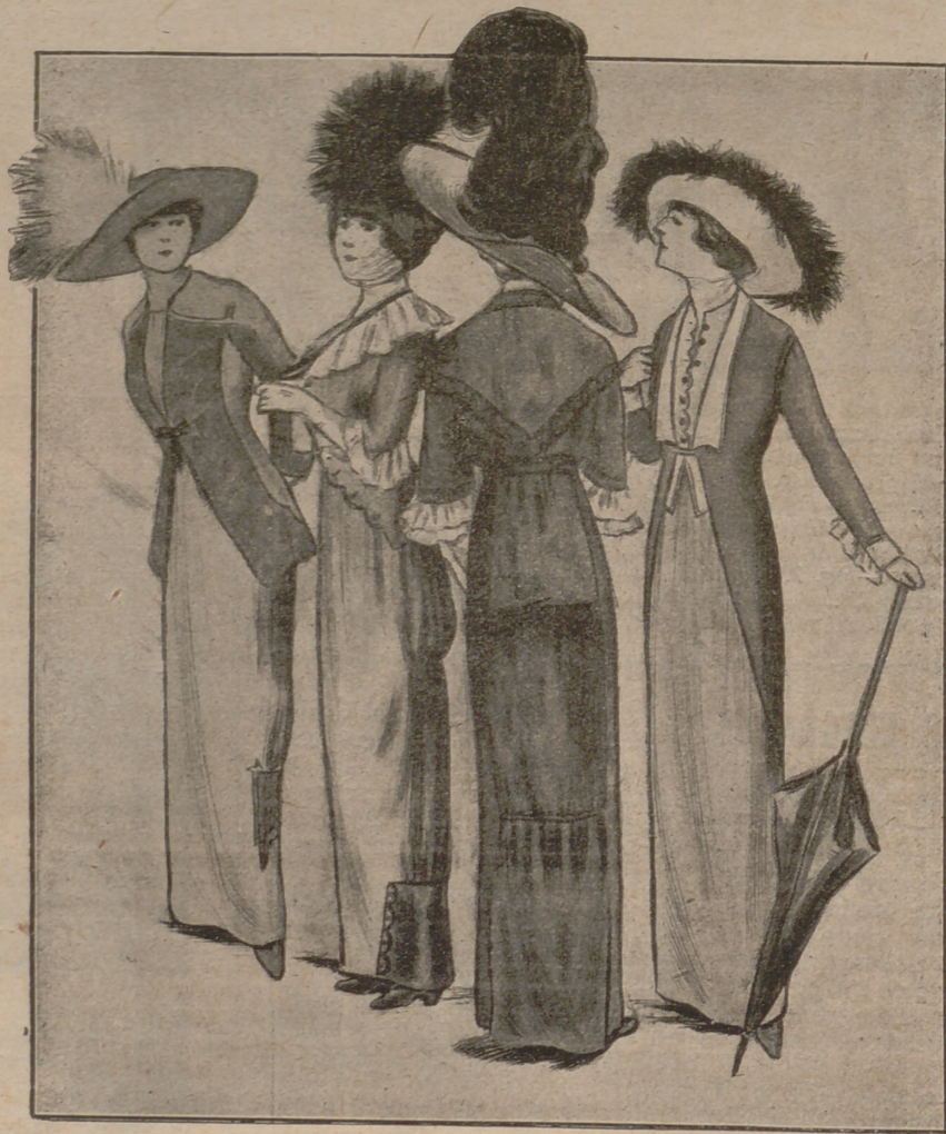
Fig. 1. a Traje sastre de satín y paño. Falda de satín ámbar. Chaqueta de paño del mismo color. Solapas de bordados de seda. Sombrero de crin con «aigrette» en el costado.—Fig. 2. a Traje de tafetán tornasolado, azul y rojo. Chaqueta corta festoneada. Falda fruncida detrás. Gorra de crin con «aigrette» negra delante.—Fig. 3. a Traje de satín azul cuervo. Chaqueta con cuello fichú. Volantes plisados negro y blancos en las mangas. Sombrero con plumas.—Fig. 4. a Traje sastre de paño verde. Chaqueta Directorio con solapas y chaleco de satín blanco. Sombrero de crin blanco con coronas de «aigrettes» verdes.