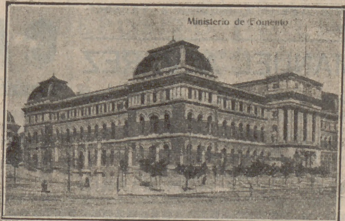
Ministerio de Fomento