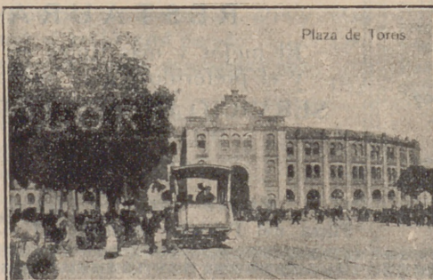
Plaza de Toros