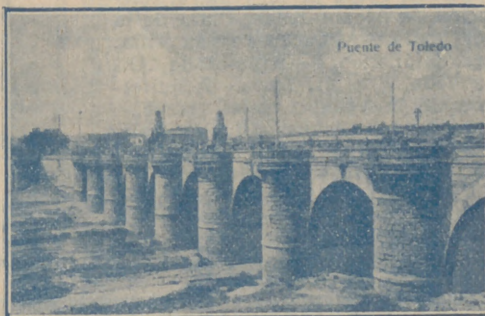
Puente de Toledo