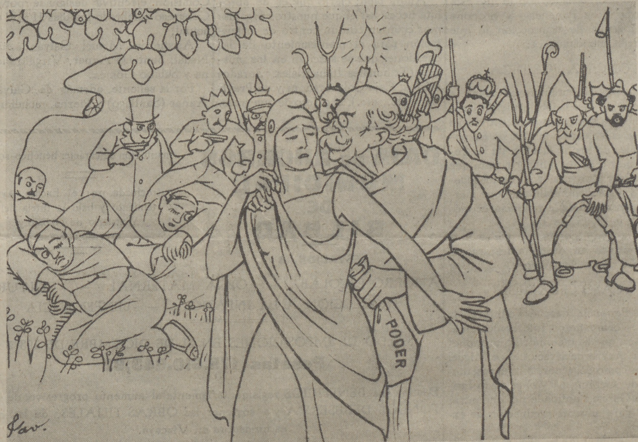
Beso de este Judas traidor, que lo mismo vende a la República que a su madre, según sea el contenido de la bolsa

Tenemos cosas de mayor interés que ocuparnos sin que nos importe nada lo que pueda hacer el tipejo ese, al que se le podía aplicar lo de «que el traidor no es menester siendo la traición pasada».