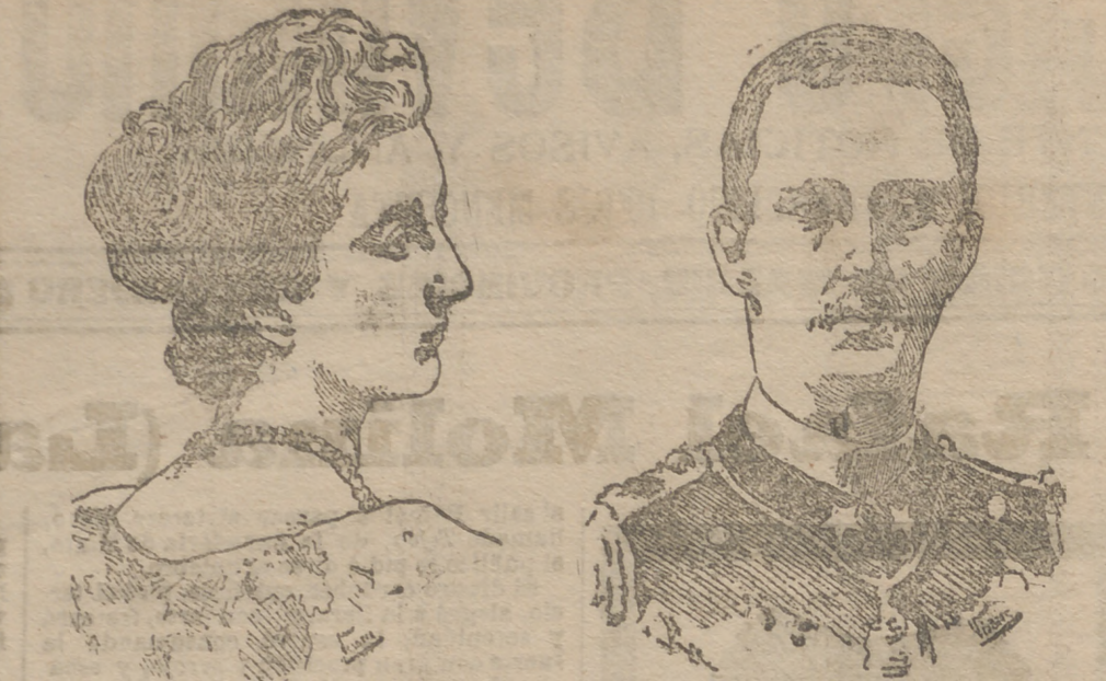
La princesa Elena de Montenegro El principe de Nápoles